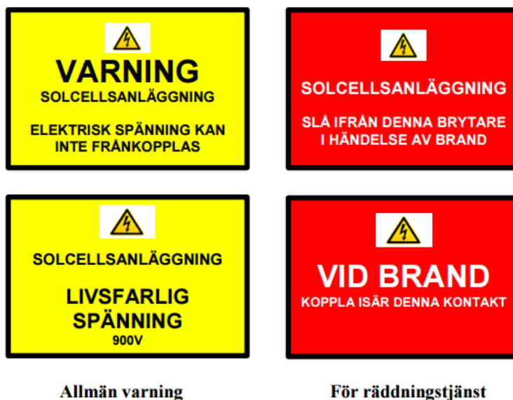
Figur 1. Fasadskylt vid entré.